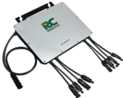
光伏微型并网逆变器